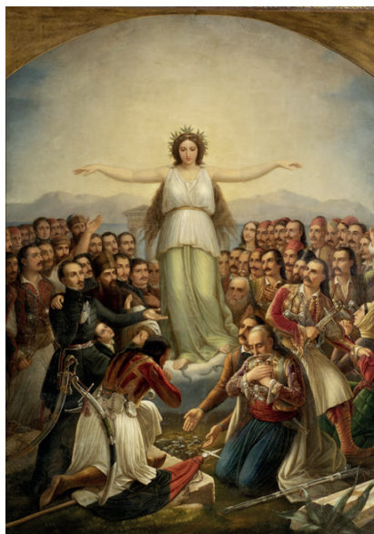
Théodoros Vryzakis, La Grèce reconnaissante (1858)